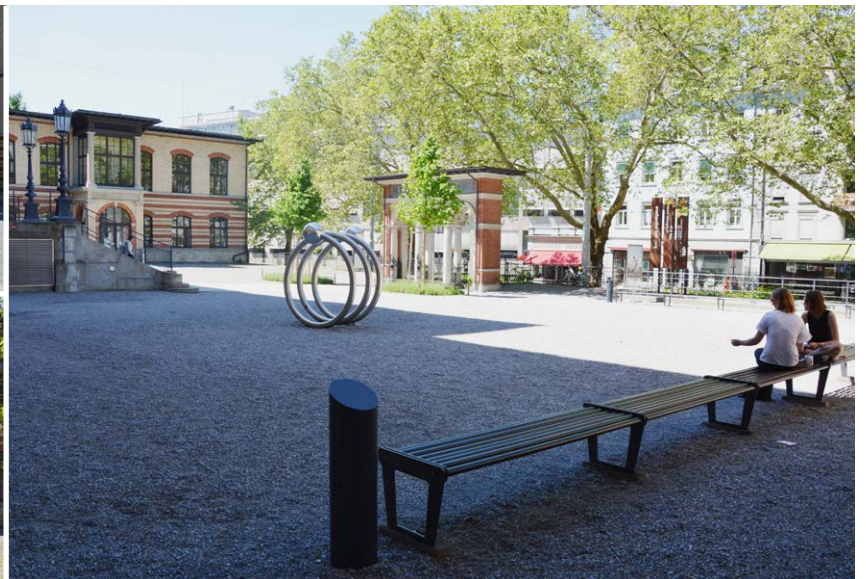
Oben: CAB Kiesplatz links Rampe